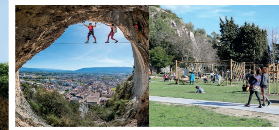
LA VIA FERRATA

Los 5 recorridos de orientación de Grenouillet: Itinerarios de dificultad creciente a los pies de la colina de Saint-Jacques. Pueden descargarse en el sitio web o recogerse en la Oficina de Turismo de Cavillon.